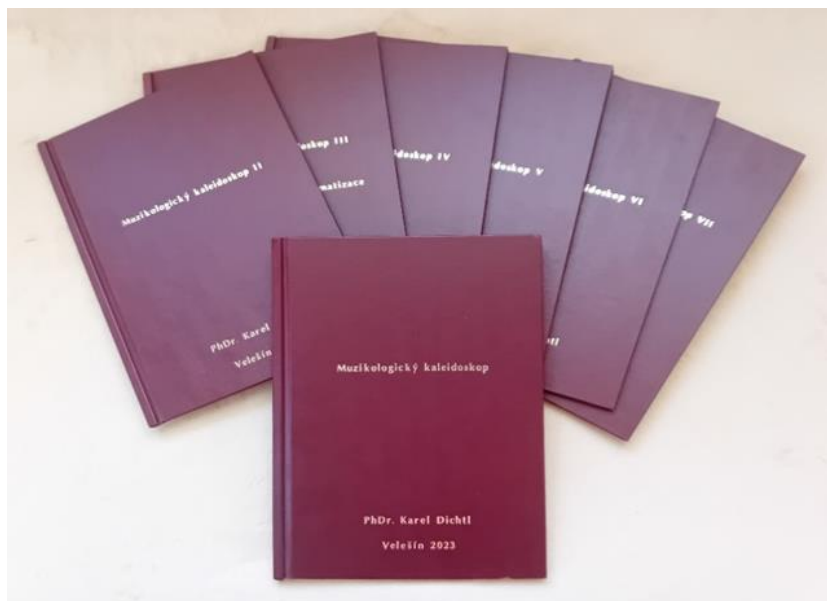
Obr. 4 Titulné listy zborníkov Muzikologický kaleidoskop I-VII.