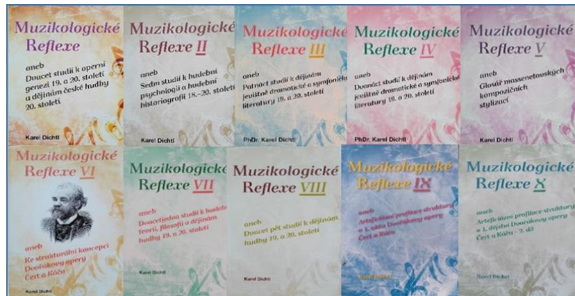
Obr. 3 Titulné listy Muzikologické reflexe I-X.