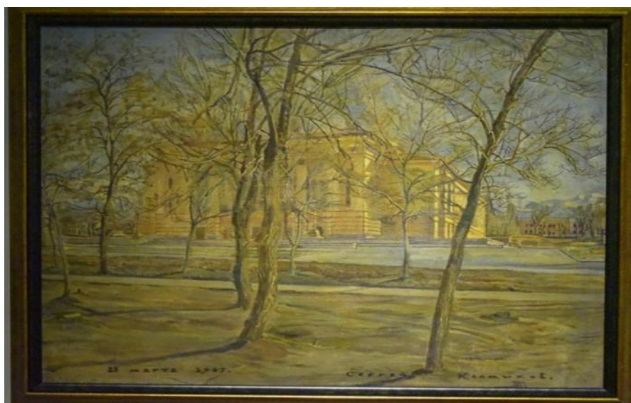
Илл. 6. Калмыков С. «ГАТОБ Оперный театр»