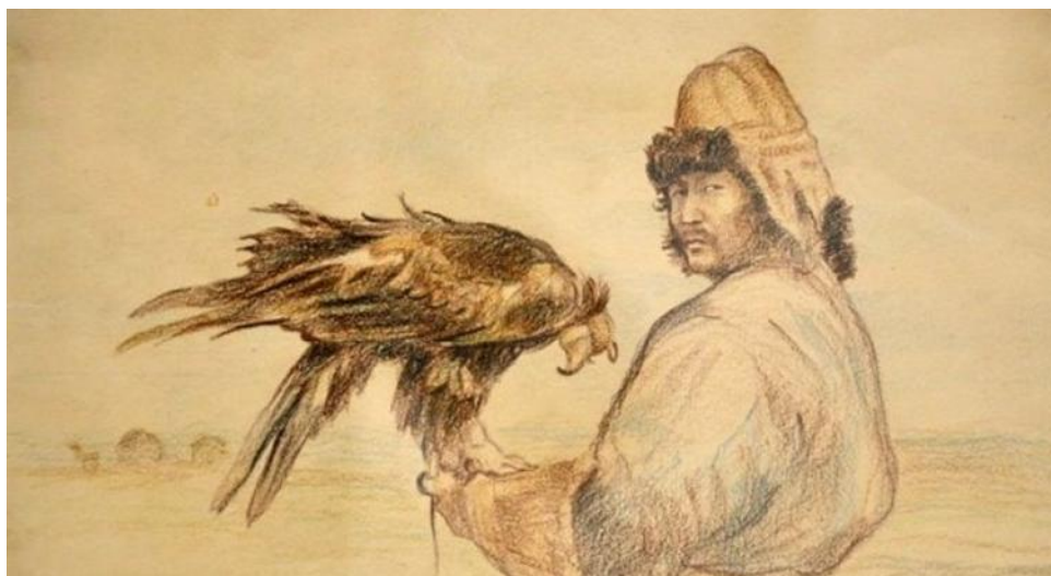
Илл. 4. Каптерев В. «Охотник с беркутом ярки»