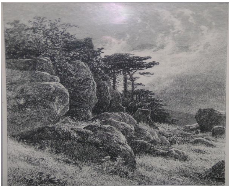
Илл. 3. Шишкин И. «Офорт»