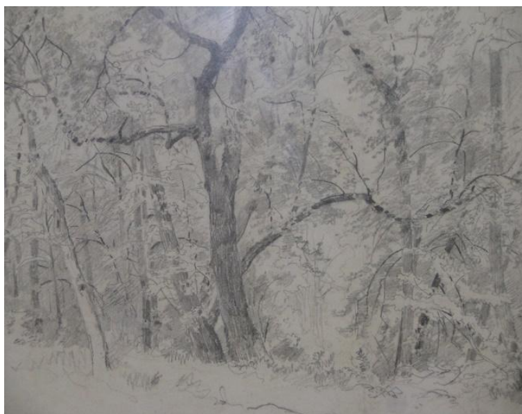
Илл. 2. Шишкин И. «В лесу»