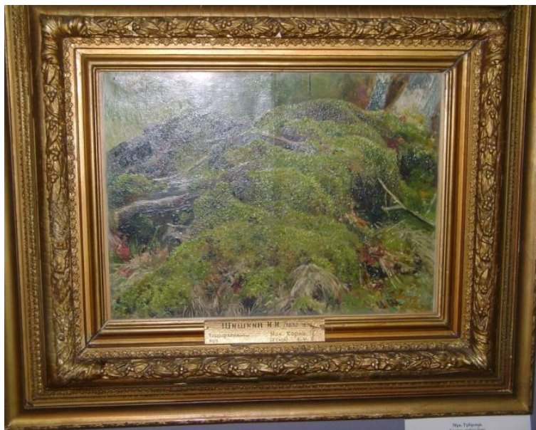
Илл. 1. Шишкин И. «Корни»